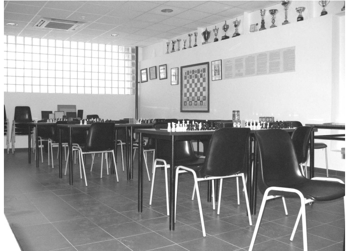
Un precioso local de ajedrez, en el que no se puede jugar al ajedrez.

tra una nueva sede acorde a su categoría. Un local diáfano espacioso y céntrico con todas las modernas comodidades que nuestro juego requiere para ser ejercitado. ¿Un lujo, una bicoca? Bueno, algunos defectillos , también tiene, que no todo el monte es orégano y nunca es completa la felicidad en la casa del pobre. Unos acabados no muy brillantes y algunas imperfecciones en la instalación, que se van solucionando poco a poco. Una entrada algo ruinosa e inadecuada que seguro que cuando se acondicione quedará chulisima . Unas normas de convivencia con otras entidades cuando menos peculiares (eso de encerrar el mando del aire acondicionado en el sótano bajo llave, no sabemos si por seguridad o economía, resulta surrealista tirando a kafkiano ). Y sobre todo unos vecinos de arriba escandalosos como ellos solos, que cuan caballos desbocados galopan en manada sobre nuestras cabezas haciéndonos añorar el piano y los gorgoritos de la Coral, y lo que es peor desplazándonos de nuestra casa, hacia el no tan céntrico Casal de